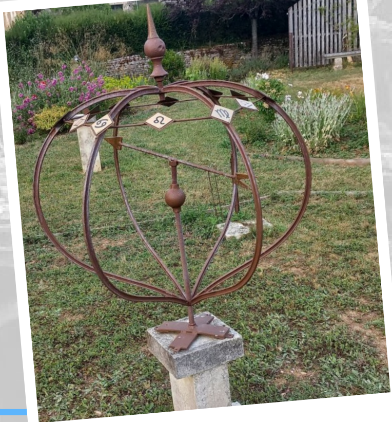
SPHERE CELESTE ...