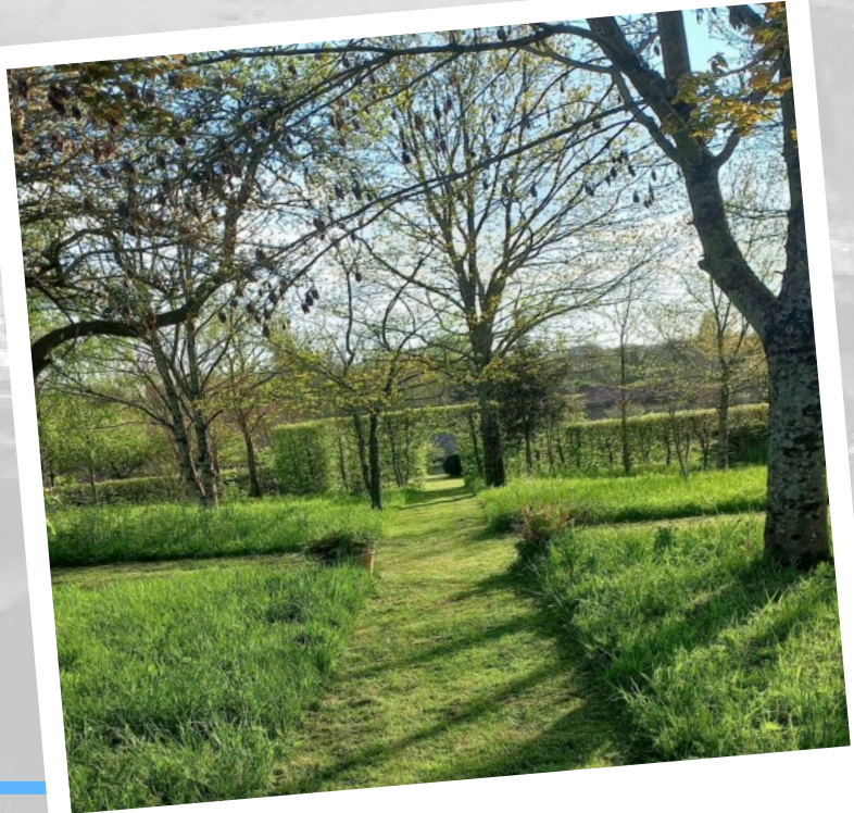
LE PETIT BOIS