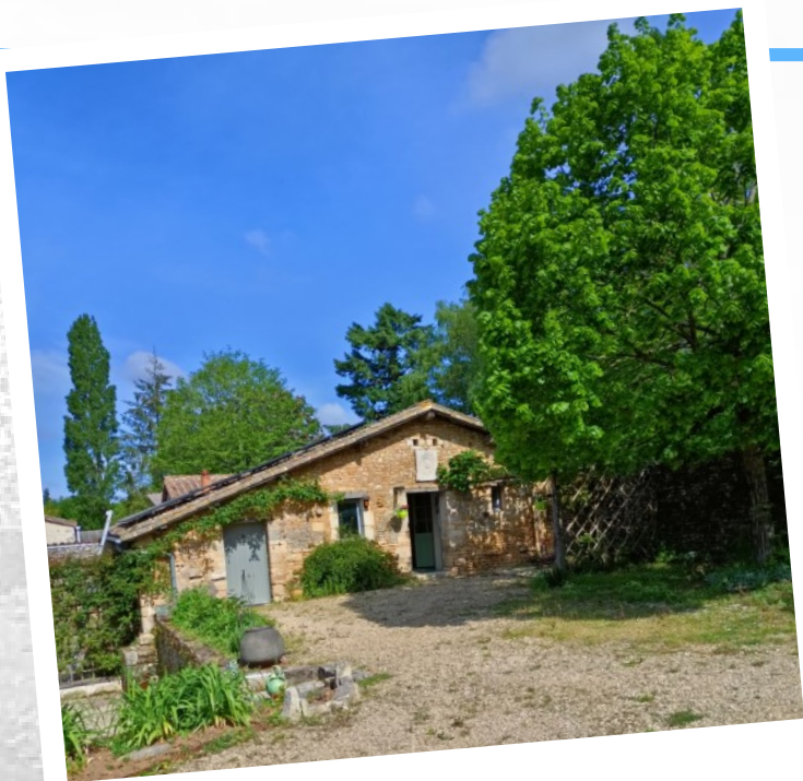
L'ATELIER DES QUATRE SAISONS