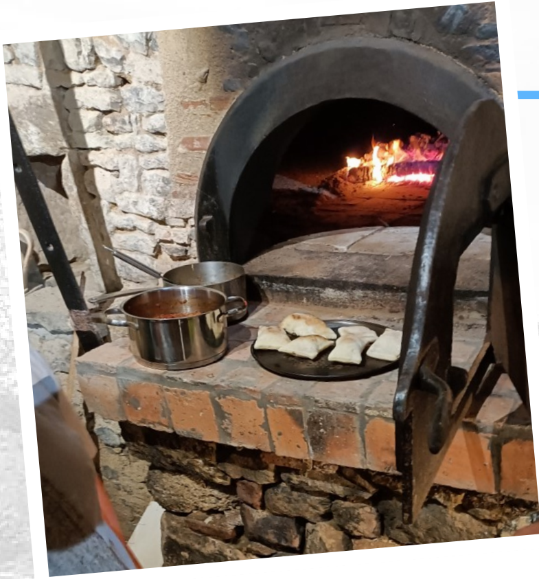
LE FOUR A PAIN