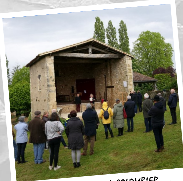
LE PETIT THÉÂTRE DU COLOMBIER ... INAUGURATION